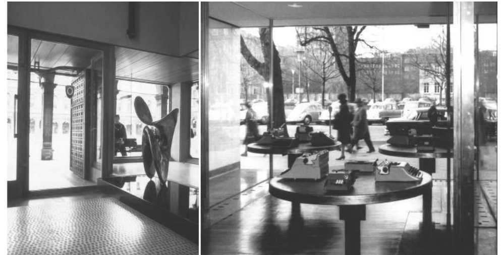
Carlo Scarpa, Negozio Olivetti, Venezia, 1958. Foto Archivio Storico Olivetti Ignazio Gardella, Negozio Olivetti, Düsseldorf, 1961. Foto Archivio Storico Olivetti

Adriano Olivetti, Gli spazi del prodotto