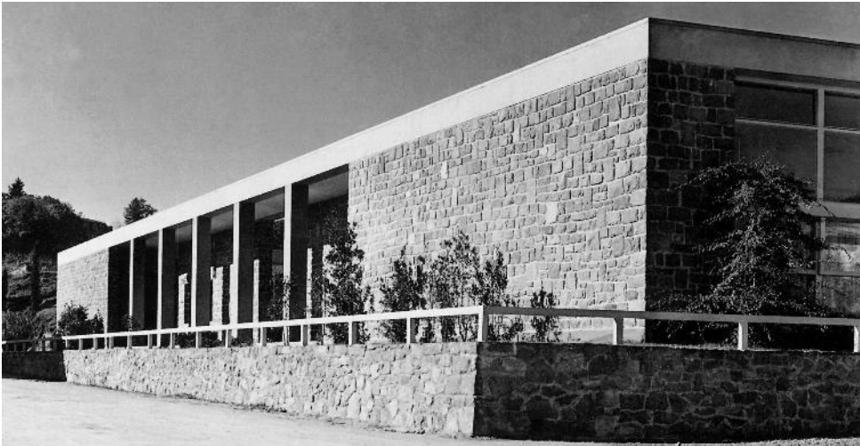
Luigi Figini, Gino Pollini Asilo nido, Ivrea, 1939 - 1941.

Adriano Olivetti, da Urbanistica e libertà locali - discorso al VI congresso dell'INU, Torino 1956