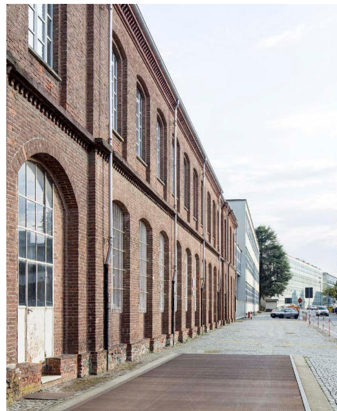
Edificio in mattoni dello Stabilimento OMI e la sequenza degli ampliamenti in via Jervis, Ivrea

Talvolta, quando sosto brevemente la sera e dai miei uffici vedo le finestre illuminate degli operai che fanno il doppio turno alle tornerie automatiche, mi vien voglia di sostare, di andare a porgere un saluto pieno di riconoscenza a quei lavoratori attaccati a quelle macchine che io conosco da tanti anni, quando nei primi tempi della mia carriera si discuteva con l'ingegner Camillo se era meglio farle venire da Providence negli Stati Uniti o da Stuttgart in Germania, quando era capo reparto il vecchio Giovanni Rey. E se adunque essi non mi vedono, mi sia consentito far sapere che come mio Padre vi ha amato, così anch'io ho osservato i suoi comandamenti. Ed anche oggi, nelle grandi decisioni della fabbrica, siamo costretti a ricorrere alla sua memoria, al suo insegnamento, alla sua saggezza perché in ognuno di noi è fatale una